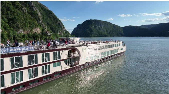
MS Nestroy im Eisernen Tor