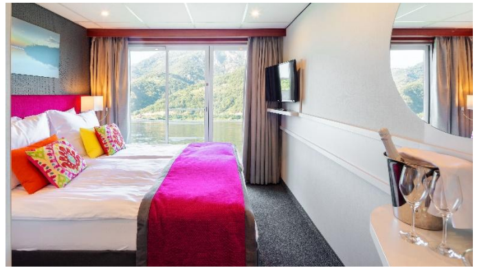
MS Nestroy, Doppelkabine Schiller- / Goethedeck