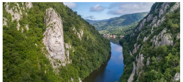
Eisernes Tor mit Decebalus-Statue