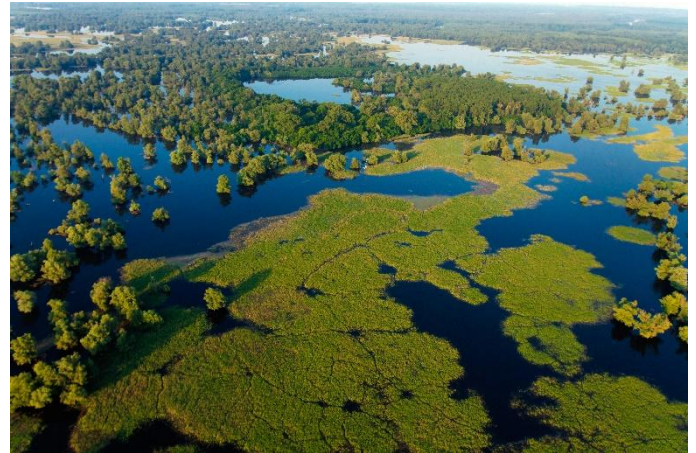
Nationalpark Kopački rit