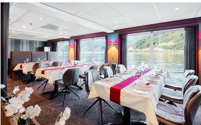
MS Nestroy, Restaurant