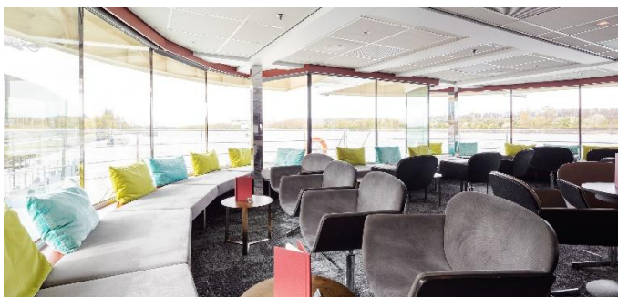
MS Nestroy, Panoramabar